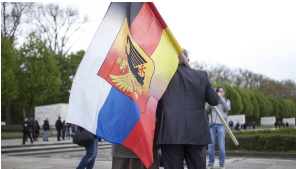
Russisch-Deutsche Flagge: Junge Russlanddeutsche identifizieren sich nicht mehr so stark als Deutsche.

Über Jahrzehnte gehörten Russlanddeutsche und die CDU/CSU untrennbar zusammen. Doch jetzt verliert die Partei an Zustimmung unter den Aussiedlern und die AfD legt zu. Kurz vor der Bundestagswahl bietet eine Studie nun erste Erklärungen.