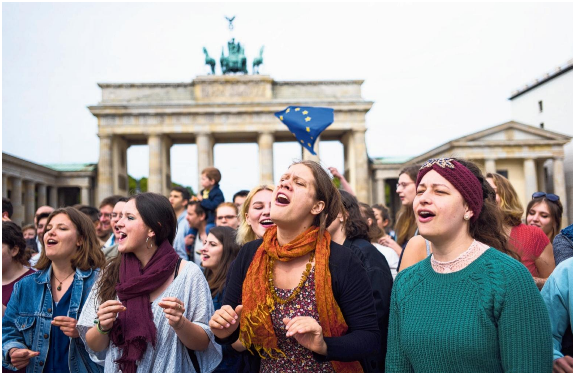
Een studentenkoor zingt voor de Brandenburger Tor het volkslied van de Europese Unie 'Ode an die Freude' op verkiezingsdag 26 mei.